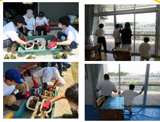
作業班からの委託作業