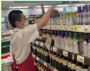
【マックスバリュ：品出し、前出し】

高等部2年生では、昨年の実習での経験や反省を生かして10日間の実習に臨みました。今回の実習を通して、自分の適正や課題、地域の事業所などを知り、卒業後の姿を具体的に考えるきっかけになりました。この実習で得たことを意識しながら、今後の学校生活や現場実習に取り組んでいきます。