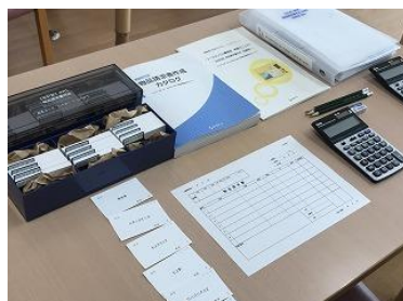
カタログ注文を想定した訓練