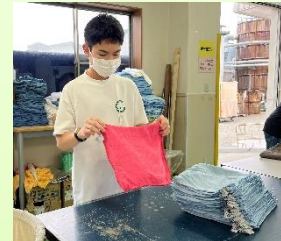
【こまどり：タオルたたみ】