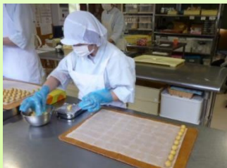
【渦上天王つくし苑：製菓】