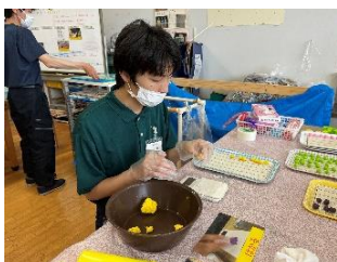
<エコ・クラフト班>