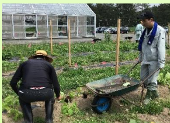
【サポートつくし：農作業等】