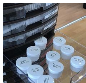
ピッキング作業の訓練