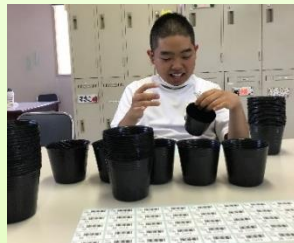
【中野つくし苑】 【園芸ポットのシール貼り】