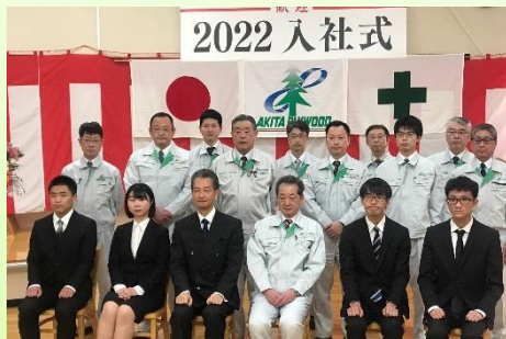
秋田プライウッド 入社式