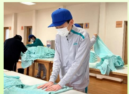
潟上ひまわりの里