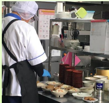
一富士フードサービス