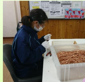
就労支援センターこまち