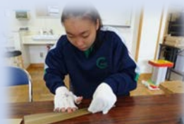
箱の仕切り折り (愛心苑)