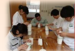
明成園さんのト イレットペーパ ー包装作業

高等部に入学して初めての校内実習。3つの作業所から資材をお借りして、作業を行いました。