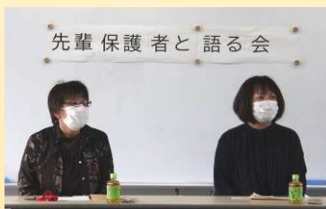
先輩保護者と語る会