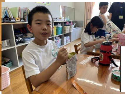
昼食は非常食を食べました。非常食の開け方や食べ方を確認しました。