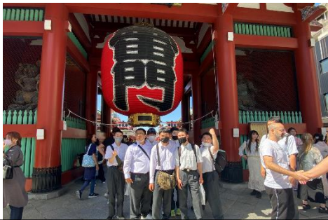
浅草寺～自分たちで電車を乗り継いで行きました。

コロナ禍にあって中学部のときは県内での修学旅行だったこの学年、ついに行きました東京・千葉!! 1日目は浅草組とチーム・ラボ組に分かれて班別活動の後、スカイツリーで合流。見学をみんなで楽しみました。2日目は東京ディズニーシーを1日堪能して、最終日はフジテレビ見学。飛行機やエレベーター、たくさんの人や物音に不安を感じていた生徒もいましたが、皆で励まし合って笑顔で乗り切りました。