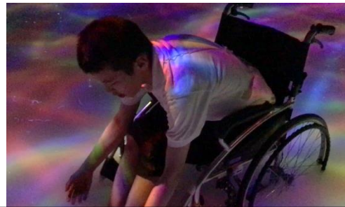
チームラボ～幻想的なプロジェクションマッピングに感動!