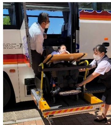
東京・千葉の移動はリフト付バスで。