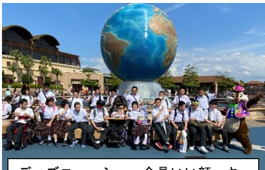
ディズニー・シー～全員いい顔。キャラクターも来てくれました。