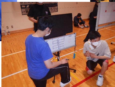
<夜のレクリエーション>