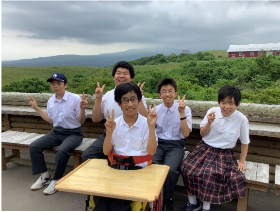
ソフトクリームおいしかったね