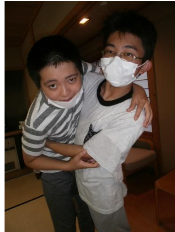
友情が深まった瞬間☆