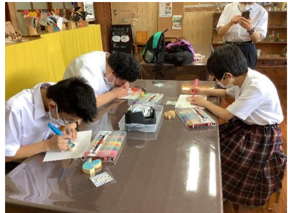
動物マグネットに色を塗っています