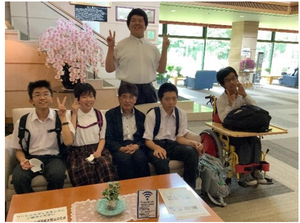
フォレスト鳥海のラウンジで