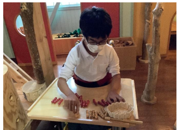
あそびの広場～ひっつき虫、たくさん取ったよ～