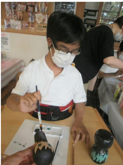
「鬼滅のこけし」を作っています