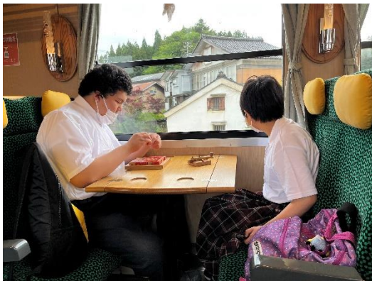
おもちゃ列車でパズルに集中