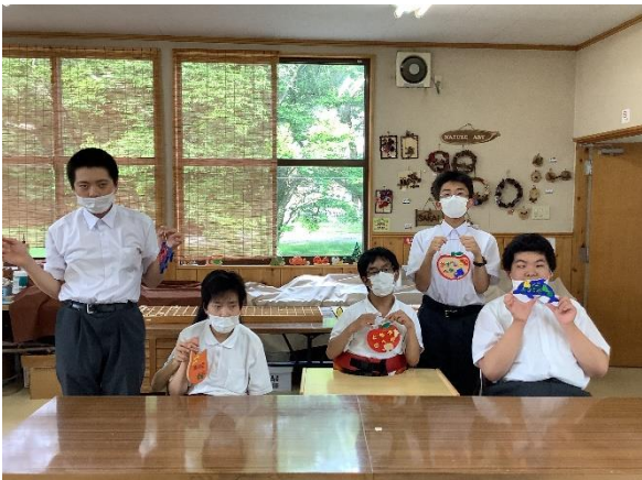
ネームプレート完成！

5人が大好きな制作体験活動をメインに、温泉やおいしいご飯、友達と過ごす時間など、楽しい思い出がたくさんできました。修学旅行、バンザイ！