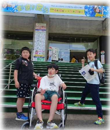
わらび座劇場の前で