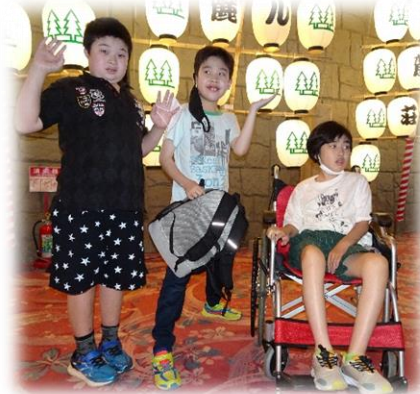
ホテルのロビーには竿燈がいっぱい ゆったりとした部屋でのひととき