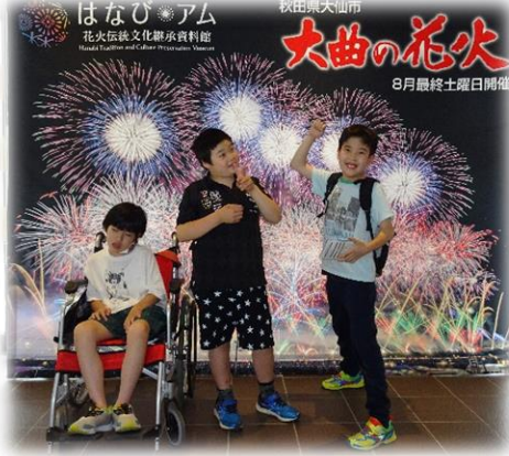
いつか本物の花火も見てみたいなあ