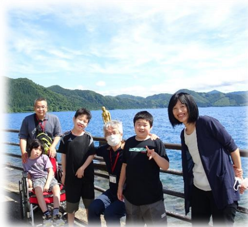
絶景の田沢湖。たつこ姫の前で