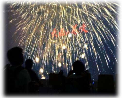
臨場感あふれる花火シアター