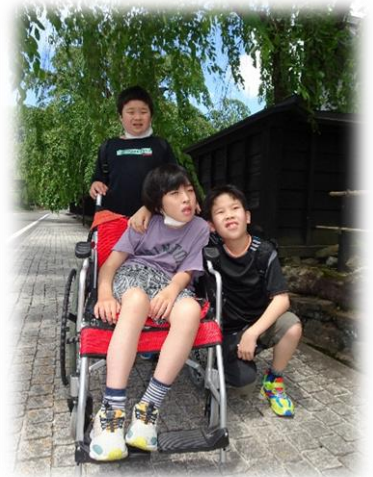
風情ある夏の武家屋敷通り