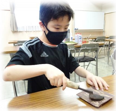
熱いコテを持って樺細工体験