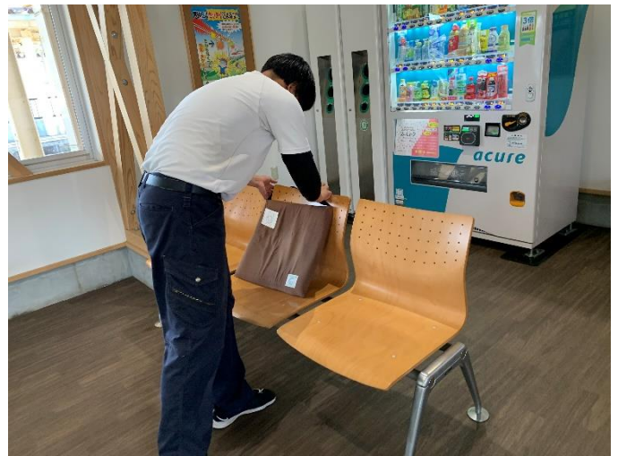
昨年の3年生が設置したクッションの回収