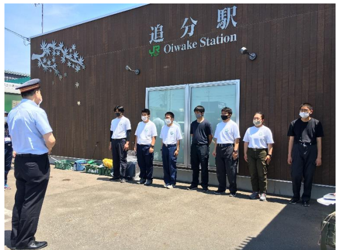
駅長さんへの挨拶