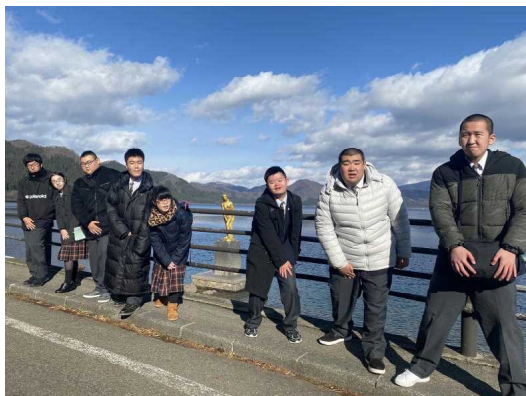
たつこ像と同じポーズで写真を撮りました。