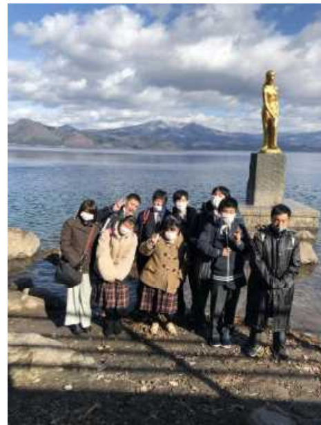
たつこ像前で記念写真