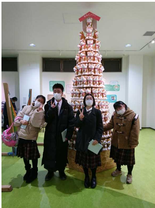
秋田犬の里の秋田犬「マサル」のぬいぐるみを積み上げたタワーの前で記念写真。

1日目は、北秋田市・大館市（大太鼓の館、秋田犬の里、小坂鉱山事務所、史跡尾去沢鉱山）、2日目は仙北市（田沢湖、武家屋敷通り）、3日目は横手市（増田まんが美術館、増田の蔵、秋田ふるさと村）を見学しました。3日間天候に恵まれ、地元秋田を再発見する旅行となりました。