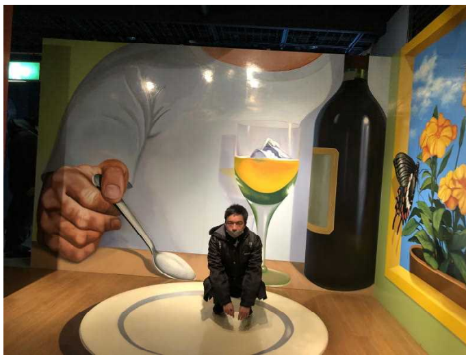
秋田ふるさと村では、トリックアートの不思議な世界を体験しました。

★修学旅行のスローガン 「楽しもう、最後まで、みんなで 最高の修学旅行」 のもと存分に楽しむことができました★