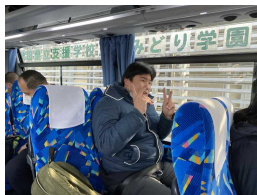
バスの中では、ガイドさんのお話を聞いたり、ゲームを楽しんだりしました。