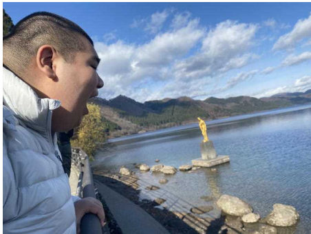
天気に恵まれて、ピカピカ光る たつこ像を見ることができました。