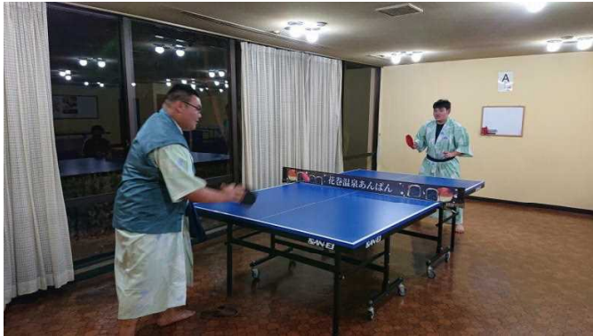
ホテルで、真剣勝負の温泉卓球をしました。