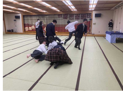
大広間で大カルタ大会に挑戦