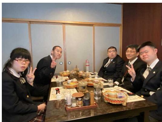
大館市で極上の親子丼ぶりをいただきました。