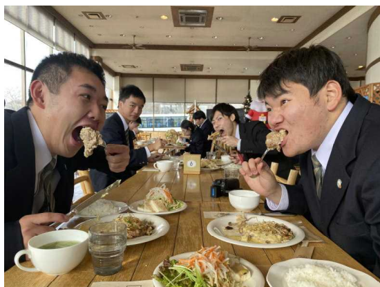
ごはんは、毎回おいしいものばかりでお腹がいっぱい食べました。