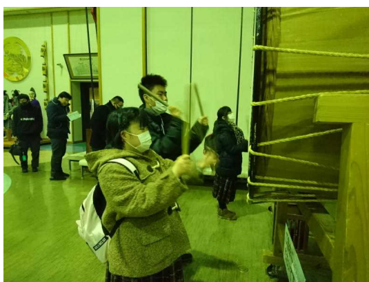
北秋田市の大太鼓の館で太鼓をおもいっきり叩きました。