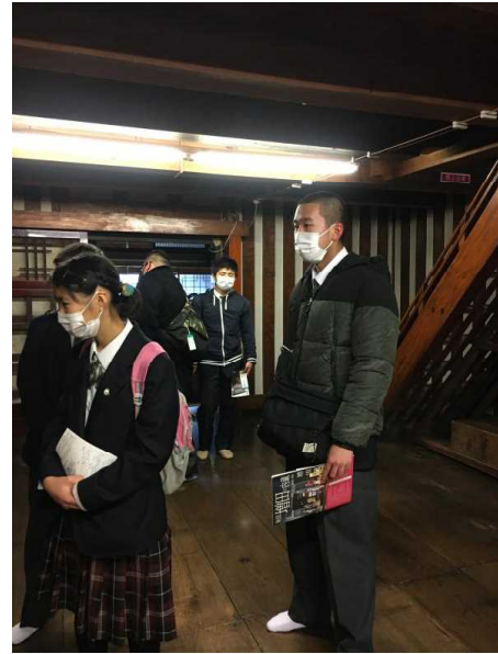
増田では、県内でもめずらしい木造三階建ての建物や内蔵を見学しました。