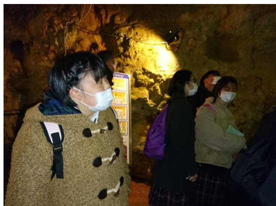
尾去沢鉦山では、鉦山を掘った跡のトンネルの中を歩きました。