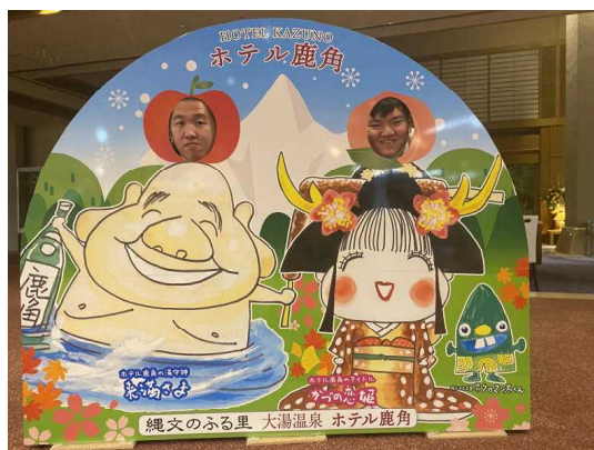
ホテルでは、大きなお風呂に入りぐっすり休みました。