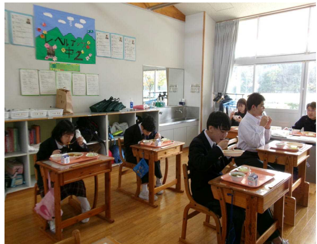
教室で味わって食べているよ