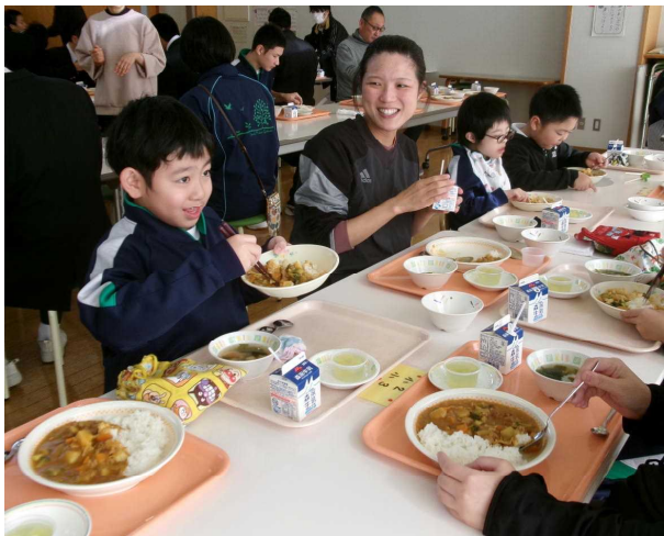
みんなで楽しく和やかに