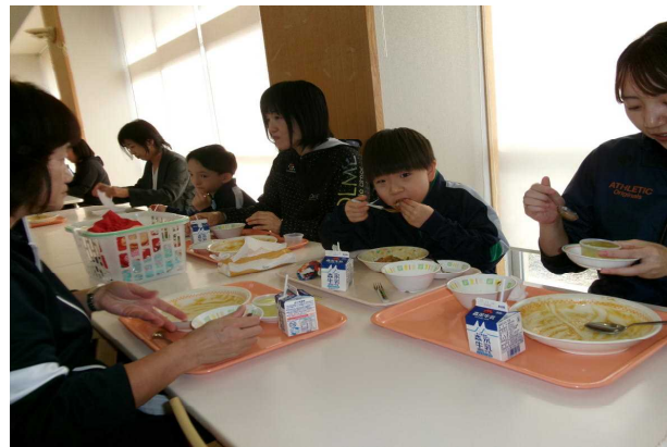
なつかしカレー、おいしいね